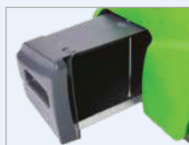
Ampio contenitore rifiuti anteriore